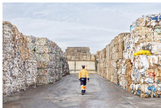
I sacchetti di carta rappresentano una parte preziosa del mix di riciclaggio della carta.

Uno studio ha scoperto che gli imballaggi a base di fibre possono essere riciclati più di 25 volte 1 . Inoltre, ha concluso che il numero di possibili processi di riciclaggio è limitato principalmente a causa della perdita di fibre che si verificano durante la pulizia del materiale. In Europa, il tasso di riciclaggio degli imballaggi in carta e cartone è già molto elevato, nel 2021 era pari all'82,5% 2 . L'alleanza 4evergreen si è posta l'obiettivo di raggiungere il 90% di riciclo di packaging a base di fibra entro il 2030 3 . "I sacchetti di carta rappresentano una parte preziosa del mix di riciclaggio della carta", spiega Matías Cowper Coles, Business Development Manager presso Alier, azienda spagnola che produce e ricicla carta. Alier è uno dei membri dell'iniziativa "The Paper Bag" che ricicla i sacchetti di carta e realizza nuovi prodotti a base di fibre, tra cui anche sacchetti di carta. Ma come funziona in pratica?