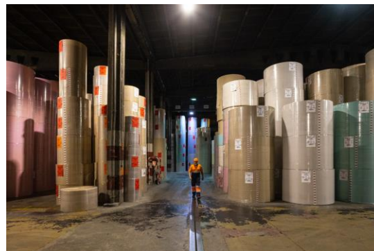
Alier produce carta riciclata al 100% per diversi utilizzi finali.